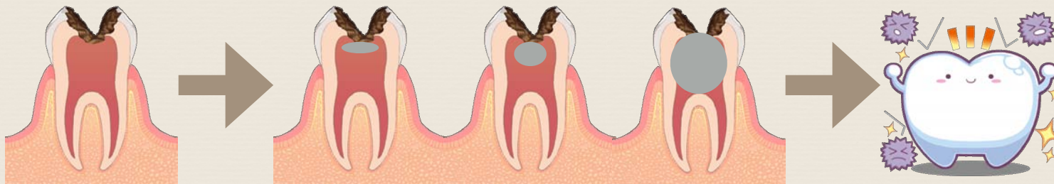
神経に到達する虫歯